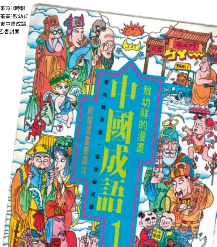
圖片來源：《時報 漫畫叢書：敖幼祥 的漫畫中國成語 (1)》乙書封面

移居至花蓮之後，敖幼祥也逐漸關注生態環境的問題。1996年6月10日，敖幼祥參與「反臺泥行動聯盟」的抗議活動，反對花蓮市擴建水泥廠，避免空氣汙染、噪音汙染的危害。反臺泥行動聯盟至議會抗議遭到警方出動強大的警力阻擋，在推擠過程中敖幼祥左眼上方掛彩，也登上新聞版面。 28 敖幼祥以行動實踐對大自然的愛護，也與其創作方向與內涵的轉變一致，並在其中表達他對於保育動物的關懷以及對生態環境汙染的憂心。而在《烏龍院》漫畫系列中，收錄於《爆笑烏龍院3》的短篇連環漫畫〈打虎英雄傳〉 29 以及《烏龍院精彩大長篇：御獸園》，敖幼祥以諧擬武松打虎故事的方式，探討人類對於野生動物的濫捕濫殺，造成物種瀕臨絕種。