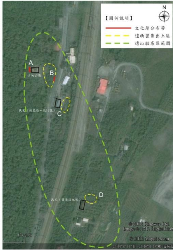
圖中最外圍虛線為調查時所見具有遺物分布的遺址範圍圖