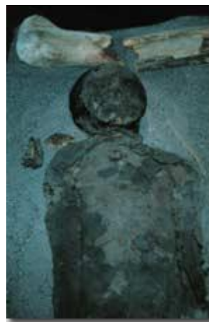
《圖三》琴可羅黑色木乃伊