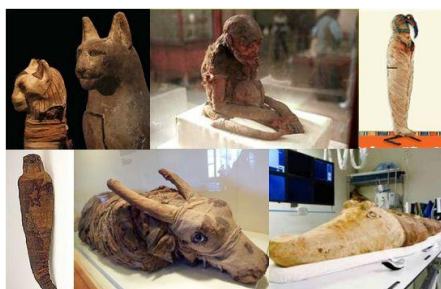
圖 3 動物木乃伊