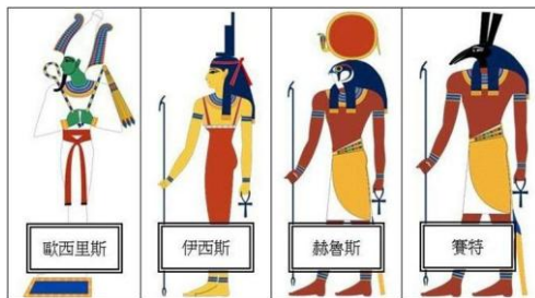
圖 2 古埃及神祇

伊西斯照著諸神的話，把歐西里斯的屍體碎塊一一的拼了回去，並把他保存的非常好。結果，真的如諸神所說的，他復活了。復活後的歐西里斯主持冥界的審判，成為了掌管埃及陰間的神。