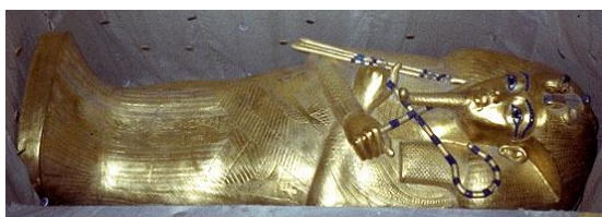
圖 5 純金人形棺

接著，打開第二層人形棺的棺蓋，第三層人形棺終於裸露出來。第三層人形棺除了用黃金製成的臉部和手是裸露的以外，其餘皆被深紅色的亞麻布覆蓋著，當卡特將亞麻布取下來，頓時屏住了呼吸，呈現在他眼前的竟然是一具純金打造的人形棺。第三層人形棺和另外兩具人形棺一樣刻有著圖坦卡門的容貌，而華美的裝飾、雕刻覆蓋了整副人形棺。