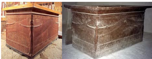
圖 4 石棺上雕刻的女神

當最後一層棺槨被拆下之後，卡特的眼睛為之一亮，呈現在他眼前的是一個用黃色石英石製稱的大石棺。在石棺的四個角，刻有伊希斯、內夫第斯、奴特、賽提這四位女神的浮雕，四位女神張開翅膀和雙臂，彷彿把棺柩抱在懷裡。