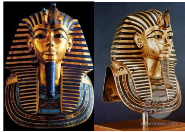
圖 6 黃金面具

沉重的黃金棺蓋離開了棺柩，躺在棺柩裡的是戴著黃金面具的圖坦卡門木乃伊，一具三千多年來長眠於黑暗的底下的木乃伊。圖坦卡門木乃伊被多層的亞麻布包裹著，占滿了整個黃金棺柩，覆蓋住頭部及肩部的黃金面具成現出圖坦卡門年輕的容貌，面具用厚重的黃金板打造而成，上面鑲著無數的寶石和彩色玻璃，相當的華麗。