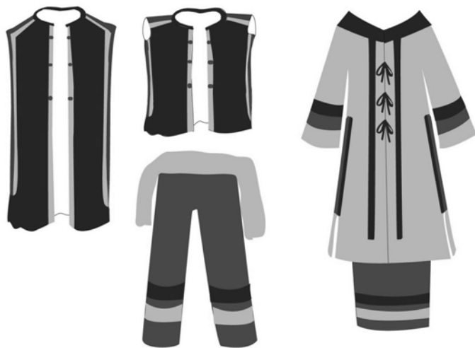
圖六：青年男女服飾造型