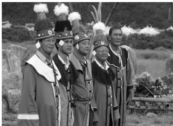
圖一：五大使者服飾