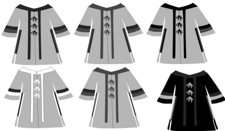
圖五：少女服飾造型