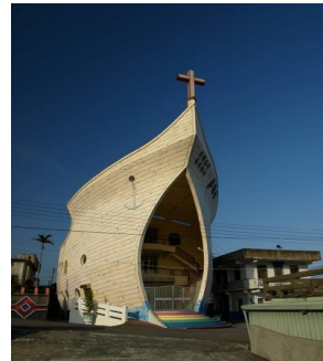
圖十 樟源諾亞方舟教堂