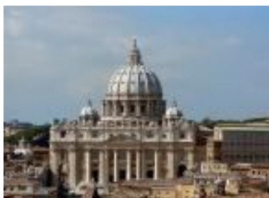
圖五 聖彼得大教堂

上，外加了很多精美的飾物（許麗雯，2008）。其特色有：1. 推崇基本的幾何體，如方形、三角形、立方體、球體、柱體等，進而由這些形體倍數關係的增，創造出理想的比例，以追求視覺上的「美」感。2. 大量採用古羅馬式建築為主題、高低拱卷、壁柱、拱窗、塔樓、特別是高聳的穹頂、和不同高度的各式柱式，以體現「和諧」與「理性」的建築構圖，以追求穩定感。3. 人體雕塑、大型壁畫、線型圖案、鍛鐵飾件等開始大量用於室內設計，追求豪華精緻，外加很多精美的裝飾，以增添富麗堂皇的氣氛。（蔡光明，2008）代表性建築有：聖彼得大教堂、佛羅倫斯聖母百花大教堂。