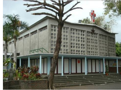
圖十四 隆昌天主堂