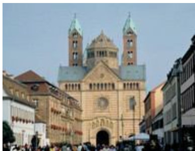
圖一 史必約爾（Speyer）教堂 （二）哥德式風格

隆和交叉拱穹隆的廣泛應用為主要特徵。由於用石材建造，可防火（史料記載歐洲中世紀多火災）又牢固，外觀雖似堡壘，但用於拱頂架構可減輕屋頂對牆的壓力。內部由於複雜而有秩序的佈局，產生特殊空間效果（許麗雯，2008）。一般窗戶都是開得很小的斜削窗洞，造成教堂內部昏暗朦朧的特殊美學效果。代表性教堂建築有：德國的《史必約爾（Speyer）教堂》、義大利的《比薩（Pisa）大教堂》、米蘭《聖安布羅鳩（ St. Ambrogio）教堂》、法國的《聖塞南（St.Sernin）教堂》、《奧頓（Autun）教堂》。