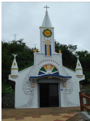
圖十九 宜灣卡片教堂

此類型教堂外觀式樣表現多為仿羅馬風格或是簡化哥德風格，通常式樣的使用不純粹，常有混用的情況，因此皆以教堂外觀主要構成元素的特徵蔚為一種風格，只是在裝飾表現上沒有西方歷史教堂來得複雜。