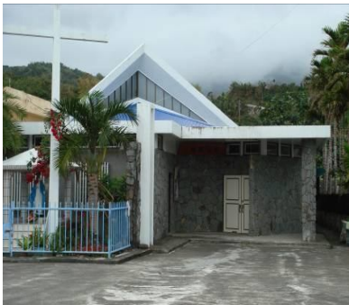
圖九 東河聖嘉俾爾堂

第一類為主量體型，即謂在教堂量體的組成上單以教友聚會空間的主量體為主，且無鐘塔量體或因應禮儀改革強調教友聚會需求所出現的次量體（張志豪，2002）。此類型教堂型態非常單純，功能及使用上均以內部空間進行不增加額外建築負擔。以外國神父所屬外方傳教會所建設的教堂多屬此類。如：東河區的聖嘉俾爾堂、樟源教堂等。