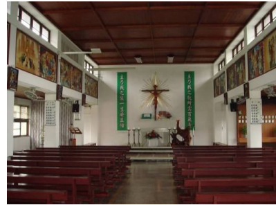
圖十八 聖若瑟教堂內觀