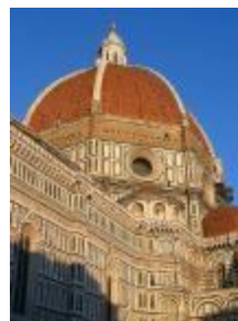
圖六 佛羅倫斯聖母百花大教堂