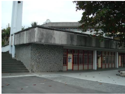
圖十三 烏石鼻天主堂

空間的主量體為主外，還加入了代表教堂特有意象的鐘塔量體與強調教友活動需求所出現的次量體。(張志豪，2002)此類型教堂量體組成型態的決定，通常與機能的使用頻率有關。大致來說，舉行堂區會議或辦理活動的使用頻率高於舉行禮拜儀式的時間應用。例如：寶桑路堂區的宗徒之後堂，教友彌散聚會空間的主量體明顯放置在複層式建築的二樓，一樓層則是做為多用途空間的次量體。還有長濱堂區的長光天主堂、宜灣堂區的烏石鼻天主堂、都蘭堂區的隆昌天主堂等。