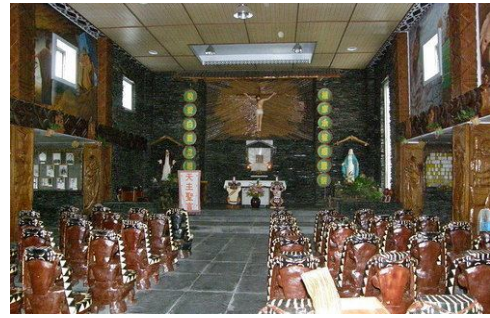
圖二十二 知本教堂內原住民風格