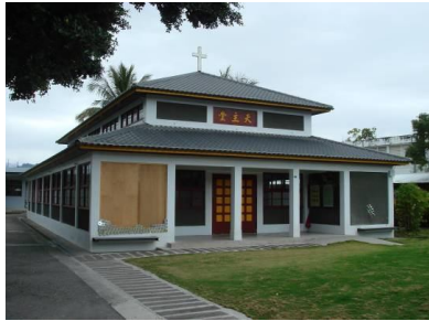
圖十七 碼蘭聖若瑟教堂

東海岸教堂在外觀上屬於中國古典式樣表現的只有一例，即為馬蘭堂區的聖若瑟教堂。此教堂的屋頂形式類似中國宮殿建築的重檐雁殿式，其屋面覆以傳統屋瓦，只是在屋面上沒有曲度的線條表現。此教堂再表達中國古典式樣上有一明顯特色，即以顏色來表達中國古典建築特有的味道，如以紅色的窗框、門框與屋簷，黃色的文字、白色的柱樑、深綠色的牆面等都是一一表現出東方建築特有的色彩意向。