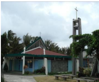
圖十一 東河小馬教堂

第二類為「主量體 + 鐘塔」型，即謂在教堂量體的組成上除了以教友聚會空間的主量體為主外，還加入了代表教堂特有意象的鐘塔量體，但仍無因強調教友活動需求所出現的次量體。（張志豪，2002）有成功堂區的中華聖母堂、東河堂區的小馬天主堂等。