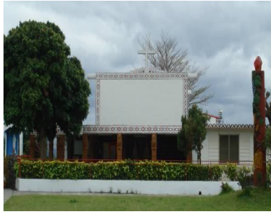
圖二十一 知本教堂