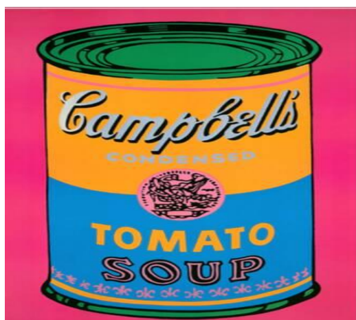
圖 5 . 湯廚罐頭