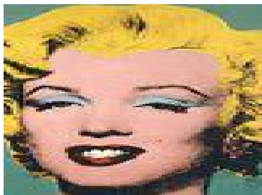
圖 4 . 瑪麗蓮夢露

建立真正的美國本土化藝術。但這個思維的基點是建立在坦率、直接與粗俗的自信上，內容則是反應大眾對物質的消費經驗。沃荷先是受到同儕藝術家的啟發，他嘗試過在畫布上撒尿，不成，轉畫鈔票、可口可樂、湯廚罐頭，最後，在電影明星瑪麗蓮夢露自殺消息傳出時，他立即大量印製夢露畫像，並因此奠定其風格。在諸多以大眾文化為主題的藝術家中，沃荷終於以最潔癖及最徹底的執著精神，奪下了「普普之王」的冠冕。