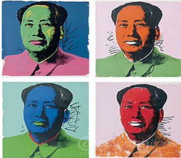
圖 2. 毛澤東