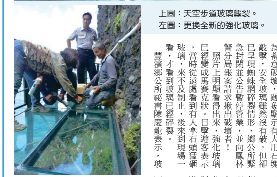
上圖：天空步道玻璃龜裂。 左圖：更換全新的強化玻璃。

記者張柏東報導、攝影 最刺激的豐濱鄉鄉民不知斷崖天空步道，昨天被發現現步玻璃疑遭人為蓄意破壞，跡象顯示有人用石塊敲擊，安全玻璃雖然沒有破，但卻已呈現蜘蛛網破裂情形，鄉公所緊急封閉並公告暫停營業，並向鳳林警分局報案請求揪出破壞者！ 照片上明顯看得出來，強化玻璃已經變成馬賽克狀。目擊遊客表示，當時從遠處看到有人拿石頭猛砸玻璃，來不及制止，後來到現場一看，才看到玻璃已經碎裂。 鄉公所強調安全優先，古道分成二段，一段是原有古道透過水泥加固、拓寬，另一段垂直懸空的懸崖則以鋼骨跟強化玻璃興建，依照安全承載量是二二〇人次，現場管制同時只能有一百人次進入步道以策安全。 強化玻璃用兩層各一公分厚的玻璃黏貼而成，每平方公分可承受二五九公斤壓力，遊客惡意用堅銳石塊擊碎玻璃角落仍會碎裂，所幸僅擊碎第一層玻璃，第二層玻璃依舊完好，雖無安全顧慮但為維持美觀，昨天下午三點已請維修廠商更換全新的玻璃。