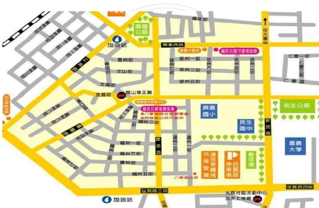
圖 1.1 嘉義市西區福民社區地圖 (福民社區通網站提供) 1

為配合政府推動社區營造的政策，福民社區在黃朝明先生等地方賢達人士率先響應下，邀集士紳等 58 人（理監事 14 人、會員 44 人），更於 2004 年 1 月成立「福民社區發展協會」，在嘉義市政府的積極輔導下，辦理社區營造績效良好。