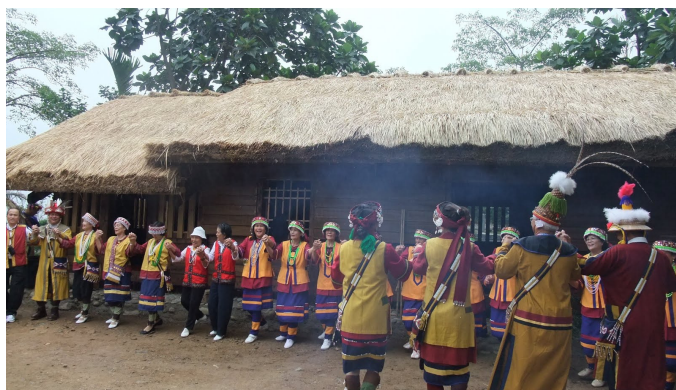
圖三 撒奇萊雅族樂舞

過去的農業生活中，族人經常是一邊唱歌、一邊工作，歌曲的節奏與抑揚頓挫的曲調撫慰著勞動者的辛勞，也加速工作的進行。其歌曲內容多樣，有男女對唱的情歌、收工後所唱跳的、喝酒聊天、背孫子聊天邊唱的、流傳與南勢阿美族與撒奇萊雅族之間序事型的歌曲、族人農閒自娛所唱等等。