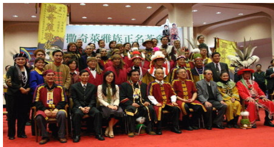
圖十一 行政院長、原民會主委與頭目長老們合影留念