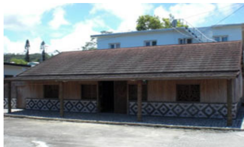
圖六 花蓮縣水璉部落傳統家屋

房舍外圍部份，在前方設有一廣場，可以曝曬農作物或是飼養動物（圖七），同時也在其周圍種植番龍眼、麵包樹、茄冬樹等樹種。家屋的後方留有狹長的空間，做為與他人房舍空間的界線。