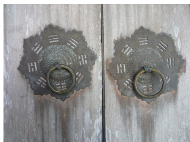
圖四 撒奇萊雅族八卦式門把

早期的撒奇萊雅族人家屋的結構也是以竹木、茅草爲主，但漢人進入奇萊平原開墾之後，撒奇萊雅族人會向漢人（特別是福州人）來學習建築房屋的技巧。在花蓮市的撒故兒、壽豐鄉的水璉及瑞穗鄉的馬立雲，都可以看到外觀爲漢式建築的撒奇萊雅族家屋，這些房屋並非由漢人所建造，乃是由撒奇萊雅族人向漢人學習建屋技術，再回部落的男性共同搭架家屋。從家屋的型式、工法，都有著漢式建築的味道，甚至有些撒奇萊雅族人的門把是八卦式的造型（圖四）