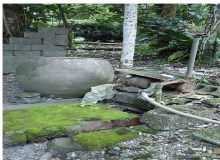
圖七 馬立雲部落（廁所、浴室）

房舍外圍部份，在前方設有一廣場，可以曝曬農作物或是飼養動物（圖七），同時也在其周圍種植番龍眼、麵包樹、茄冬樹等樹種。家屋的後方留有狹長的空間，做為與他人房舍空間的界線。