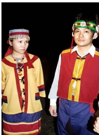
圖二 撒奇萊雅族男性、女性