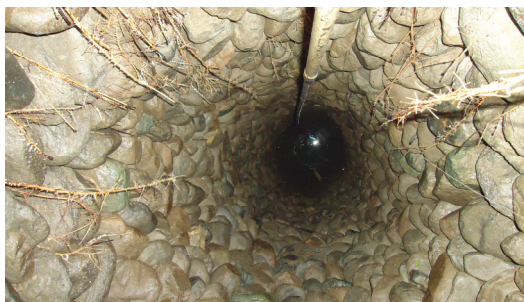
圖八 馬立雲部落（水井）