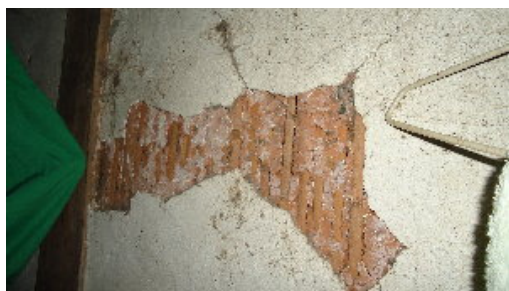
圖五 馬立雲部落家屋（牆）