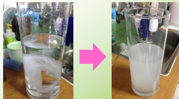
衛生紙於水中狀態

研究顯示，衛生紙投入馬桶增加之固形物沈澱量，對建築物污水處理設施（化糞池）或公共下水道初沉設施有效容積之影響試驗，顯示 投入衛生紙至馬桶不但不會造成堵塞，而且經沖水後已發生破碎 ；但誤用面紙取代衛生紙投入馬桶時， 不但不易破碎發生，而且也因此容易造成馬桶堵塞 （無論是否與污物一併投入馬桶），其主要原因係因面紙中添加了 濕強成分 ，不易分散破碎。