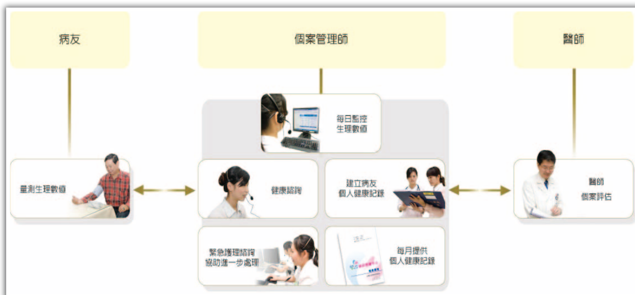
圖 2 遠距照護模式示意圖