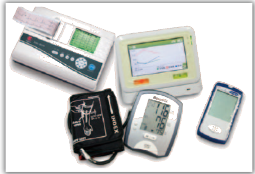
圖 1 單導程心電圖機（左上）、血壓機（中二）、與血糖機（右下）

隨著科技的進步，許多生理量測儀器都漸漸的發展成熟，體積和價格都比往常下降許多。如同以前一台電腦有一個房間大，現在幾乎人人一台桌機或是筆電及平板。過去只能到醫院用昂貴大機器量測的一些數值、資訊，也漸漸走向微小化，便宜化，讓每個人家裡都可以有一台。像這樣的機器為數不少，包括血壓、血糖、脈搏心跳、血氧、體溫、心電圖等等資訊的量測儀器都已經製作微小化且成本大幅降低，讓一般民眾也可以進行選購，在家裡自行量測自己的身體狀況。近年來，各項量測儀器更陸續推出利用網際網路及電話的資料傳輸功能，利用不同的機制將所量測的資料以數位化的形式儲存且傳輸至電腦，甚至更進一步的嵌入第三代行動通訊技術（3rd-Generation of Mobile Telecommunications Technology Network, 3G Network），讓資料的傳輸更為簡單，方便未來的儲存以及自我健康分析使用。圖 1 為各式各樣微小化的生理量測儀器，表 1 整理國內外不同廠商所製造的生理量測儀器以及提供的服務。