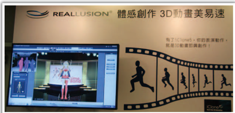
圖 3 3D 立體試衣間示意圖。圖片來自 u-car.com.tw [5]