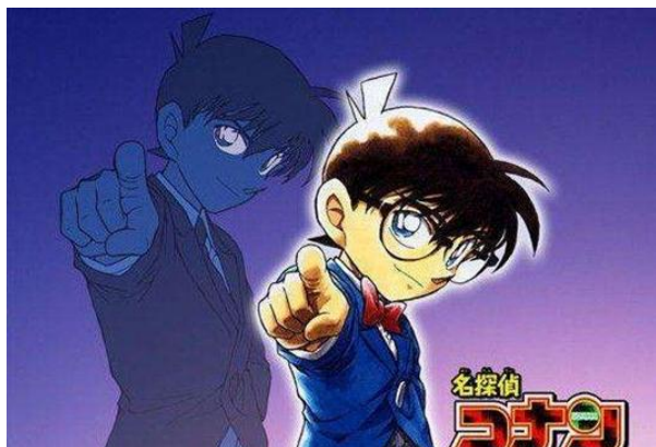
圖一 真相只有一個

過去二十年，柯南可說是日本的動漫代表作之一，風靡全球男女老少。每年一部的柯南電影更形成一種儀式，為閣家觀影的最佳選擇。作者青山剛昌還曾記得那一句最最經典的名言——「真相只有一個」。對於柯南來說，哪怕是再狡猾的敵人也逃不出他的手掌心。如此這般的柯南是否有深深印入你的心中呢？