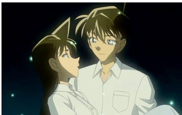
圖四、新一與蘭(google 搜尋)