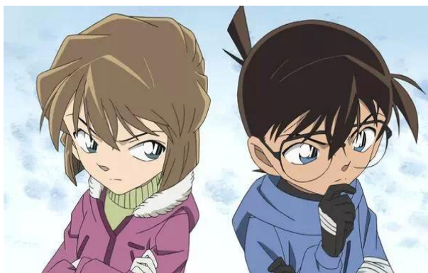
圖五、柯南與灰原