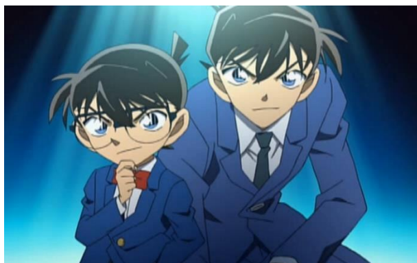
圖一、工藤新一(google 搜尋)

本作男主角，17 歲，擅長足球和小提琴。在被黑衣組織強迫服下名為 APTX4869 的毒藥後，身體縮小成莫約 7 歲的模樣，情急之下化名為江戶川柯南(Edogawa Conan)。由於出色的推理能力，被稱為「日本警方的救世主」、「平成的福爾摩斯」。和毛利蘭是青梅竹馬，常被蘭稱作「那個推理狂」，喜歡的人是蘭。為了避免蘭也受到黑衣組織的威脅，遂以辦案繁忙作為長期不見人影的藉口。(以下因情境及敘述上的需要，新一、柯南兩個名字會交互出現，但指的皆是同一人：工藤新一)