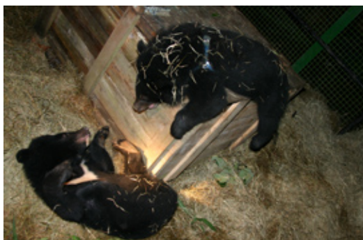
上圖：在小籠舍內觀察小熊。