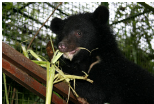
小熊啃吃芒草，在野外已不致於餓死了。

優勝劣敗、適者生存，小熊與小豬就是個例子。在小熊還沒進駐半開放的森林之前，小豬就先進駐，俟小熊移入2、3個星期之後，小豬仍佔據了涵洞棲身，二者相安無事。約二週後，研究人員發現小豬背上有幾個抓痕，才知道並非小熊對小豬沒興趣，而是抓不到，雖然先前母熊曾教過，可能技術還不嫻熟。後來，才在2隻小熊合作之下捕殺成功，血腥的物競天擇呈現在眼前。小熊對獵捕到的動物，若一次沒全部吃完，會