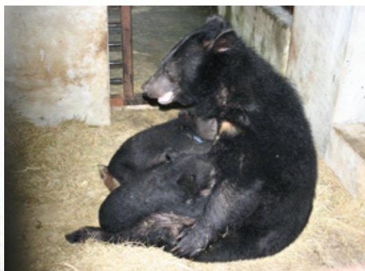
小熊隔離一段時間後，母子聚時立即授乳情形。

聽過的叫聲，當人靠近時，聲音立即歇止。後來，以錄影監測才確認是小熊的呼叫聲。我們錄下了叫聲，並測試母熊對此叫聲的反應，發現母熊急於欲往聲音的方向跑，這或許是小熊的召喚或求救聲吧？小熊經照料