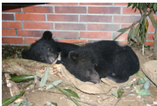
上圖：攀上樹頂，山蘇是牠喜愛休息的地方。