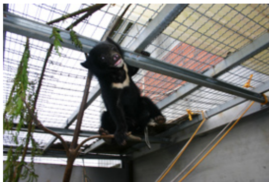
倒吊於屋頂是小熊遊戲或逃避的地方。

將剩餘的以土或樹枝葉掩蓋之，呈現了「埋食」行為，餓了再來吃，也有把剩餘的獵物拖拉到樹枝幹上，樹上的巢位常是被利用作為享受獵物的好地方。