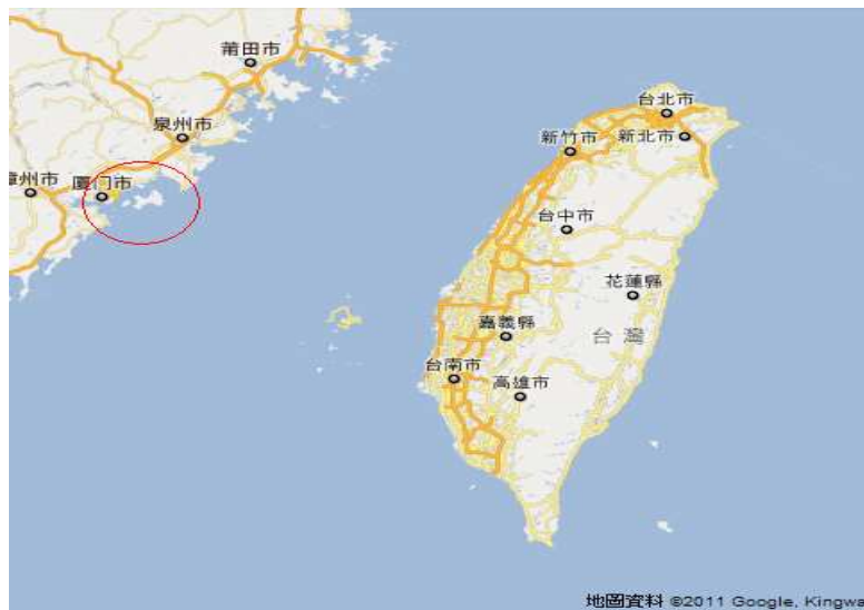
圖(一) 台灣與金門的相對圖

這次研究的範圍是金門縣的金門高中，因為位於離島，資源資訊較於封閉，而且人口數不高，縣內僅有一座高中，造成學校社團缺乏校與校之間的競爭與交流。