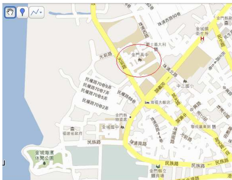
圖(二)金門高中在金門的位置