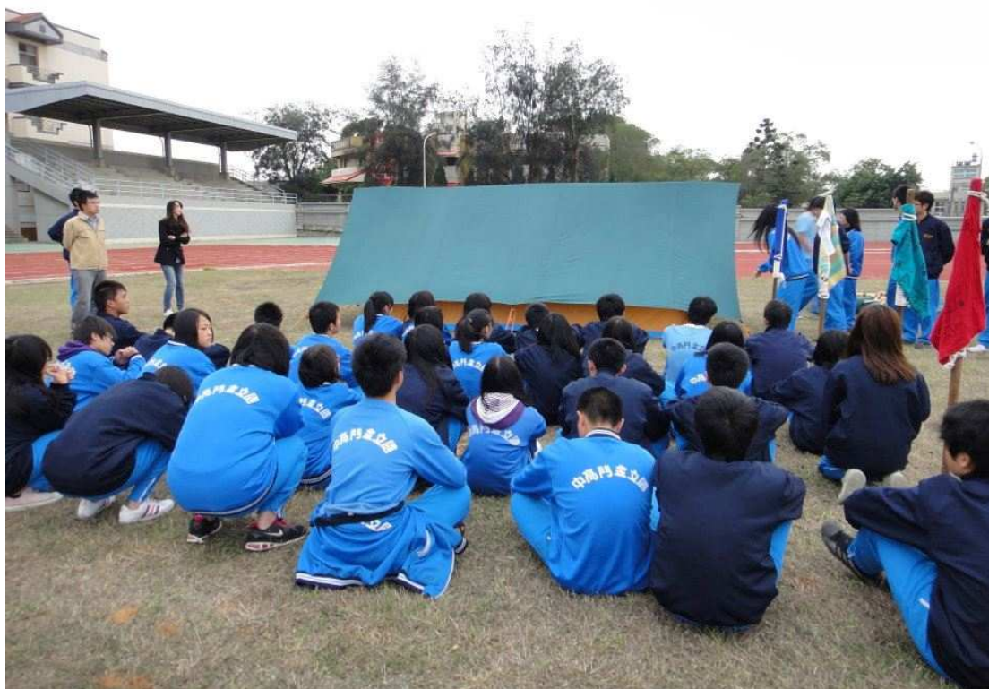
圖(三) 社團活動情形

參考論文《社團參與態度、社團凝聚力與人際關係之相關研究-以台北縣參與社團國中生為例》註(一)、《彰化縣國小高年級學童社團活動參與、自我概念、社團學習滿意度之研究》註(二)，在重視多元學習、多元智慧的九年一貫下，社團活動是最直接的課程。社團活動是一種採同學志願、性向，以分組方式實施的活動，活動重視學生在固定的學科外可以另外的多方學習，其組織由指導老師協助，為不分班級、年級充實學習的學生團體。社團分為體育性社團、音樂性社團、服務性社團等多種類型，供學生多元選擇，學生在每個禮拜裡，有一至兩節聯課活動的課程讓同學參與社團活動，學生可以離開課本親身體驗、學習技能，與同儕團隊行動。