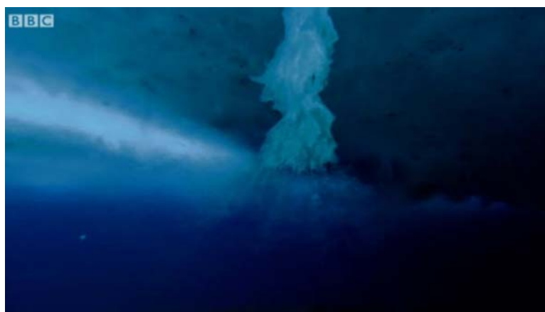
圖一，民視新聞台節目「挑戰新聞」中穿插BBC影片（註八）

民視新聞台節目「挑戰新聞」內容談論有關於全球暖化可能造成南極冰層底下因冰層融化導至萬年病毒被釋出，但節目中卻引用了 BBC 使用延時攝影介紹海底冰苟生成的奇特景觀的影片。