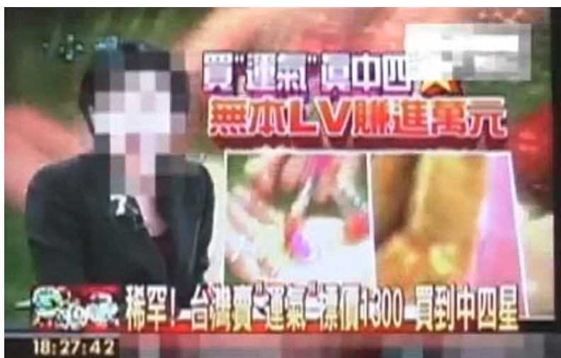
圖六，電視台以買運氣中了四星彩為標題（註十四）

在記錄片上傳至網路後，記錄片導演接受了媒體的採訪，但卻被各大媒體指責不該造假新聞，而對於媒體不查證的做法則隻字未提，而採訪內容充斥引導性問答以及斷章取義，甚至利用受訪人在公開場合接受採訪時緊張忘詞，將新聞播報為學生不了解何謂新聞專業，有誤導觀眾之嫌。（註十五）