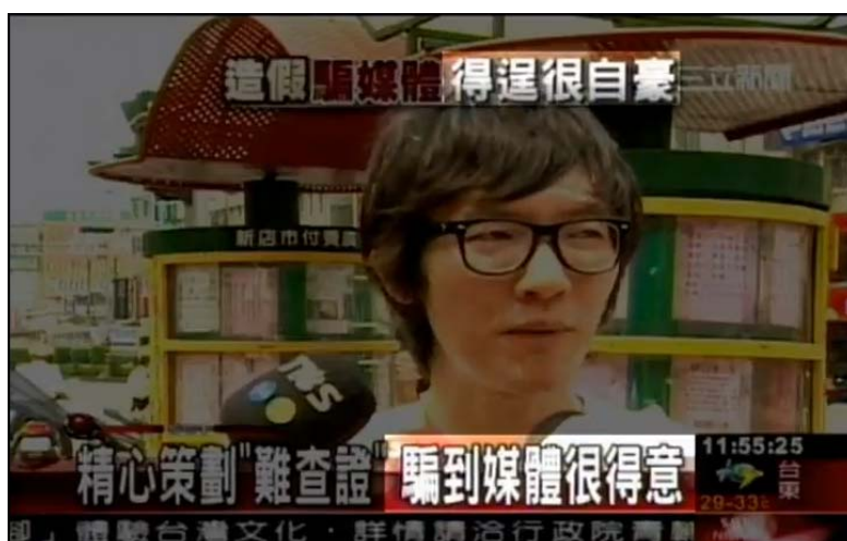
圖七，紀錄片導演接受訪問，卻被媒體抹黑（註十六）

在記錄片上傳至網路後，記錄片導演接受了媒體的採訪，但卻被各大媒體指責不該造假新聞，而對於媒體不查證的做法則隻字未提，而採訪內容充斥引導性問答以及斷章取義，甚至利用受訪人在公開場合接受採訪時緊張忘詞，將新聞播報為學生不了解何謂新聞專業，有誤導觀眾之嫌。（註十五）