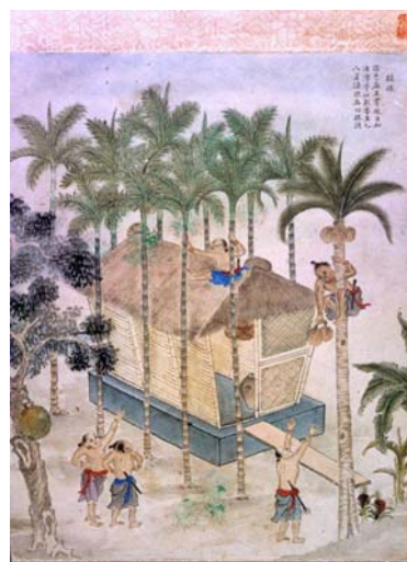
圖一，翻拍自《番社采風圖題解》（杜正勝 1998）。

平埔族善於奔跑和攀越，本圖描寫麻豆、蕭壠、目加溜灣等社八月採椰子和檳榔的情形。這一帶平埔族村落風景宜人，家屋清潔，諸羅知縣周芬斗（1749-51）〈麻豆社〉詩云：「家家小圃林陰護，一畝枕椰一草堂」，即是本圖的寫照。平埔族腰佩短鐵刀，是他們日常不離身的工具；左邊樹幹上長的水果乃熱帶植物波羅蜜。檳榔和椰子雖然是臺灣南部習見的植物，但據荷蘭《東印度事務報告》，1635 年麻豆社平埔族歸順，簽訂合約，麻豆人「並帶來一些檳榔和椰子樹種植，以示其誠心，願將他們的土地和收穫獻給荷蘭人。」檳榔和椰子對平埔族而言可能還有更深的意義。