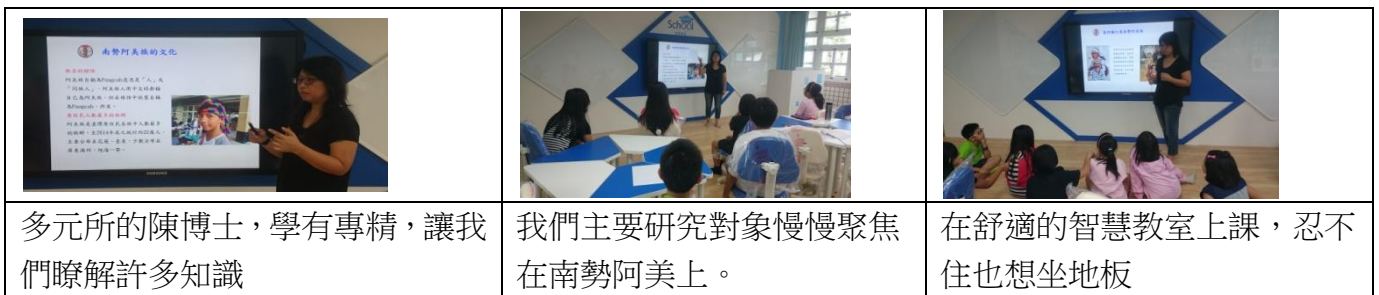
圖 6 訪問陳博士過程圖

種在部落外，再做一個隱密的出入口，清兵就進不了部落了。後來清兵來了，他們看到那一整片的刺刺的樹就進不去了，結果有幾個清兵看到了他們(撒奇萊雅族)的出入口，於是清兵就一個一個的進去，沒想到撒奇萊雅族早就知道清兵會看到出入口，早就在那條河(出入口)等他們了，清兵一進去，撒奇萊雅族人就一個個的慢慢的砍下他們的頭，後來其他清兵知道了這件事，就想到了了一個辦法，隔天.....清兵又到了部落，他們就把箭後頭的毛燒火，再射進撒奇萊雅族的部落裡，結果撒奇萊雅族的部落就因此被熊熊大火燒了，撒奇萊雅族人就急急忙忙的從出口出去，沒想到撒奇萊雅人就被清兵反擊，清兵就等等等，等撒奇萊雅族人出來，撒奇萊雅族人出來後就一個一個被砍頭，後來剩下的撒奇萊雅族人就很怕，因為阿美族人很溫柔，所以剩下來的撒奇萊雅族人都跑到阿美族部落裡了，他們隱姓埋名在阿美族 120 多年，因此撒奇萊雅族的人數就慢慢的慢慢的減少了。