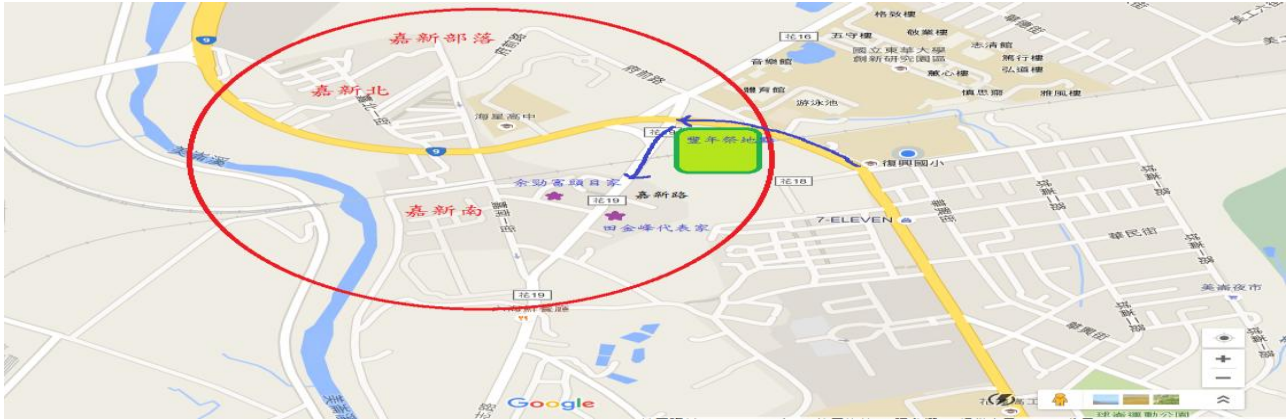
圖 4 嘉新村地理位置圖

要對象，是我們學校學區中的嘉新村阿美族族群，在做田野調查時，發現嘉新南的阿美族，大多來自十六股，也就是現在的「豐川」，「豐川」位於奇萊平原的北方，清時多稱之為「十六股」，至西元一九三七年時才由「十六股」改稱為「豐川」，台灣光復之後，又改稱為「豐村」。十六股地區，地下水豐沛，加上米崙溪常有水災，所以嘉新部落的阿美族耆老告訴我們，他們在一百多年前，就是因為大水患，才搬遷到現在的嘉新部落。