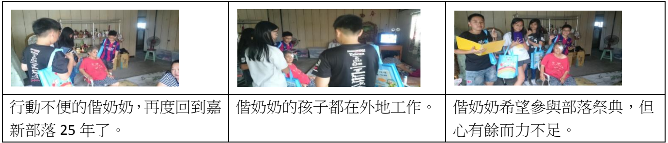
圖 10 訪問偕奶奶過程圖

新部落的豐年祭，對於祭典相當重視，只是因為身體不是所以這兩年才缺席。原本有傳統阿美服裝，一套一萬多元，現在穿不到所以送給其他人，目前申請獨居老人送餐照顧，沒有辦法自己料理三餐。