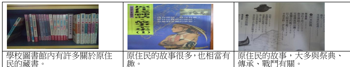
圖 16 許多關於阿美族神話故事的書