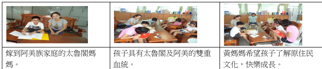
圖 18 訪問羽釵媽媽過程圖