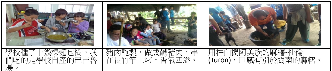
圖 15 阿美族飲食特色圖