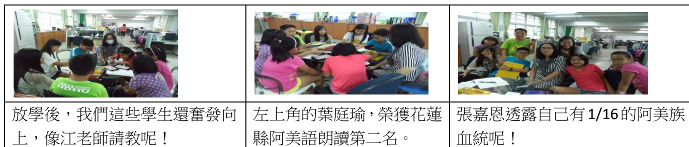
圖 17 訪問江老師過程圖

放學後，我們約江老師採訪，江老師每星期二，都在我們學校教阿美族語，江老師出生在玉里的馬太鞍部落，5歲時搬到米棧部落，40歲時才搬到現在的嘉里部落。江老師是支援教師，她在許多不同學校教書，她常常會用成功人士來鼓勵小朋友，比如說我們的校長。她認為從民國約91年開始推動族語教育，原住民孩子才有機會接觸母語，因為家裡即使有會講母語的長輩，也配合孩子，跟孩子溝通都用國語！也有些家庭是長輩因為不太會說國語，進而跟孫子無法溝通，自己最親的直系血親，竟然話說不通，這樣的狀況讓人憂心。