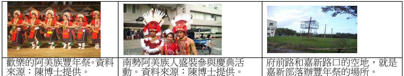
圖 13 關於阿美族祭典圖

阿美族的傳統祭儀有豐年祭、播種祭（小米）、捕魚祭、海祭、祈晴祭和祈雨祭等等。許多祭典內容原有嚴格男女分際或性別禁忌，但因時代變遷而有所更曳或亡佚。豐年祭是阿美族重要的祭祀儀式，其重要性相當於漢人的農曆年，是族人與祖先、神靈團聚的時間，通常在每年七至九月間進行，主要為耕地收穫後的時節舉辦；天數則依各部落而異，一般是由各部落耆老來決定，傳統上短則三天，多則半個月，祭祀過程與內容依各部落習慣上之不同而有差異，如年齡階層的訓練與進階、祭祀流程等。豐年祭中會進行捕獵、採集或購買食物，並由族人們共聚分食（註二）。每年七、八、九月是東海岸最熱鬧的季節，阿美族的豐年祭以歌舞與飲酒中開始歡樂的慶祝，這個祭典不單只是慶祝的儀式，它，更凝聚了族人的部落意識。阿美族的祭典不是只有豐年祭而已，還包括「捕魚祭」、「海祭」、「成年禮」等。(林建成，1996)