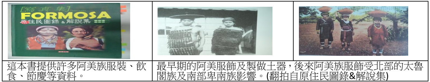
圖 14 阿美族服裝特色圖