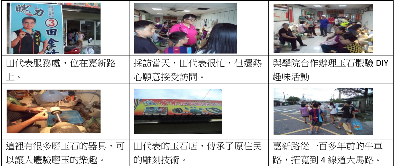
圖 8 訪問田代表過程圖