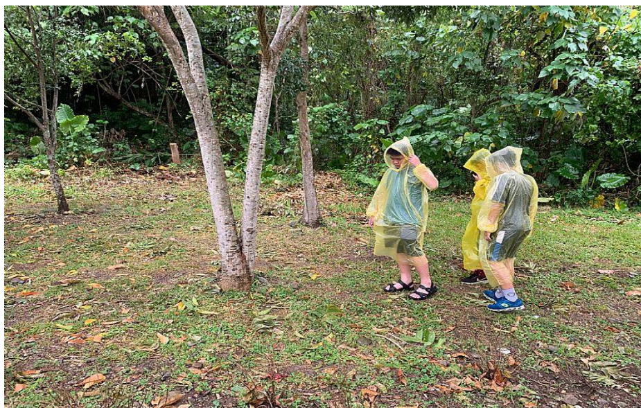
雨天也在找八星虎甲蟲的巢穴