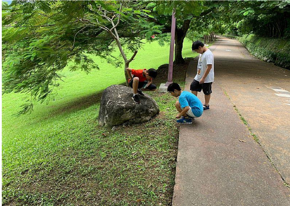
第二次找八星虎甲蟲的巢穴