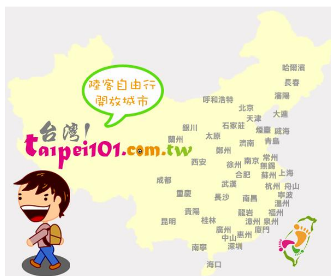
圖 1：陸客自由行開放城市