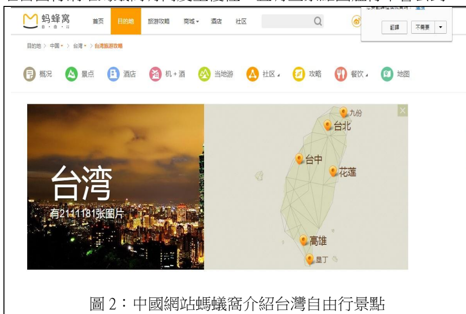
圖 2：中國網站螞蟻窩介紹台灣自由行景點

訪談自由行將近 15 組，普遍發現去的城市或景點，皆為台北、台中、高雄、墾丁與花蓮，本研究經過追問下，原來大多自由行旅客都透過網路部落格介紹這幾個熱門景點，而且經本研究發現 15 組自由行熱門景點，與大陸知名自由行網站螞蟻窩有高度重覆性，且有些景點團體行不會去到。