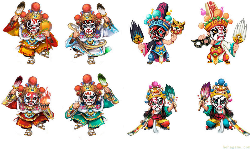
圖1：八家將的成員