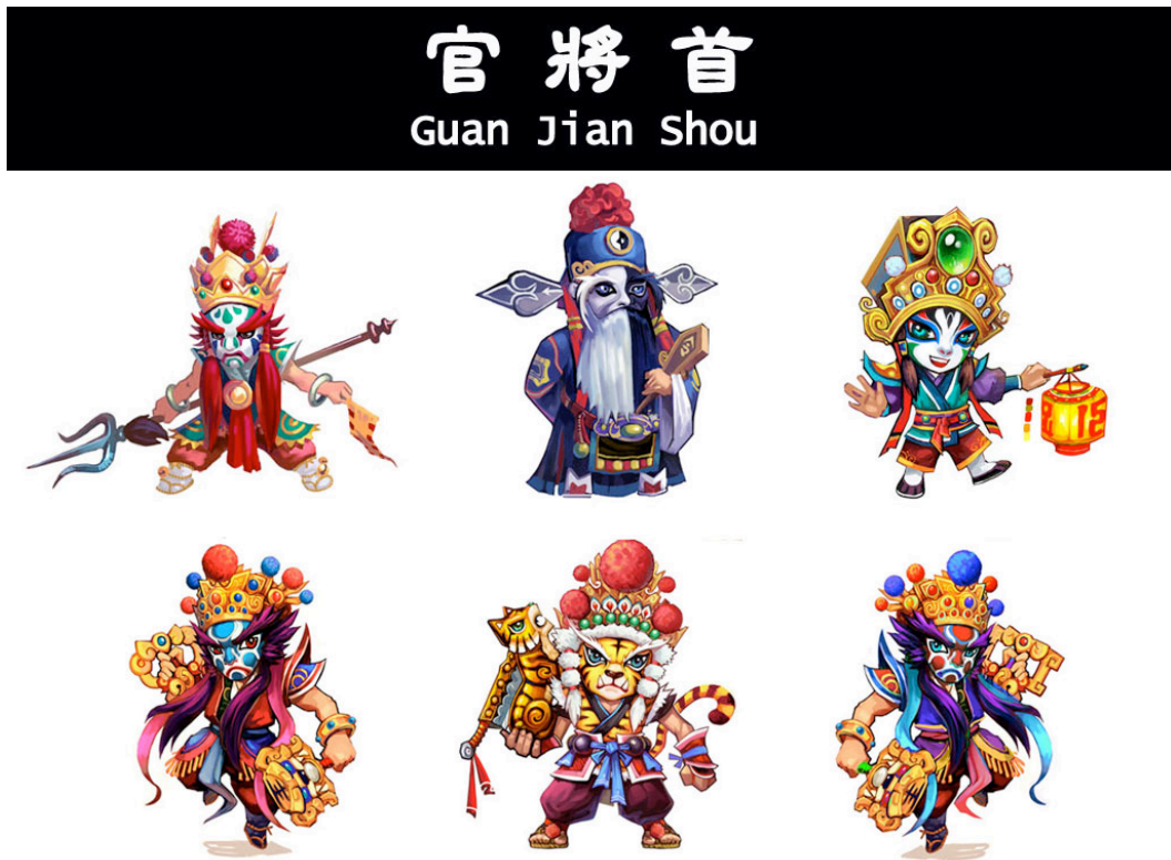
圖2：官將首的成員

增將軍以紅臉武將造型，手拿火籤及虎牌，看到好人就增加他的福壽。損將軍以綠臉武將造型，手拿三叉及令，看到壞人就減少他的性命，所以叫做「增、損」二大將軍。