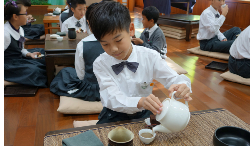
圖 8：在校學習靜思茶道