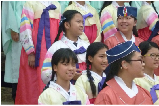
圖 1：高尚典雅的韓服