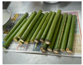
圖3、圖4：親自烹煮一道韓式拌飯