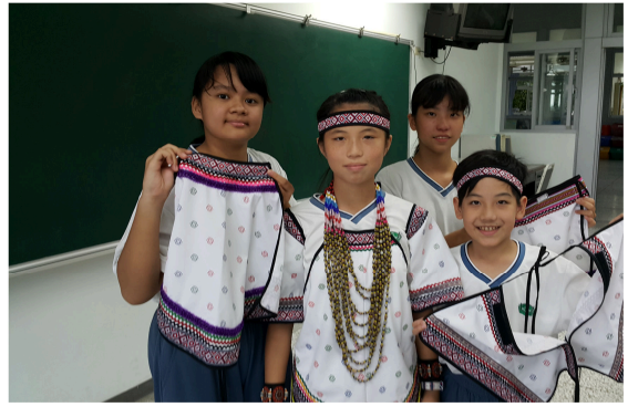
圖 2：清新脫俗的太魯閣族傳統服飾