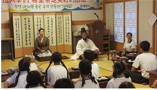
圖 7：我們在韓國體驗韓國茶道