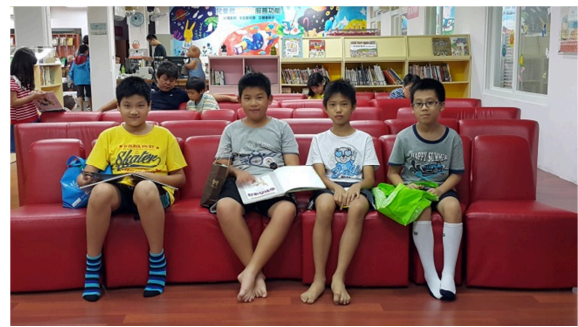
圖說：在一般圖書館閱讀，有提供置物櫃的服務，讓民眾可以放心沈浸書香