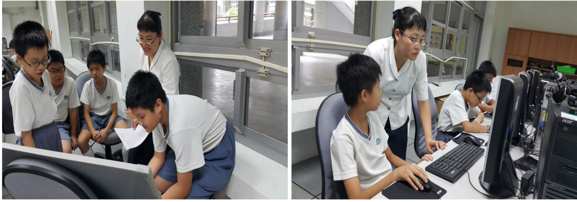
圖說：小組討論架構時，學生認真報告討論架構的內容