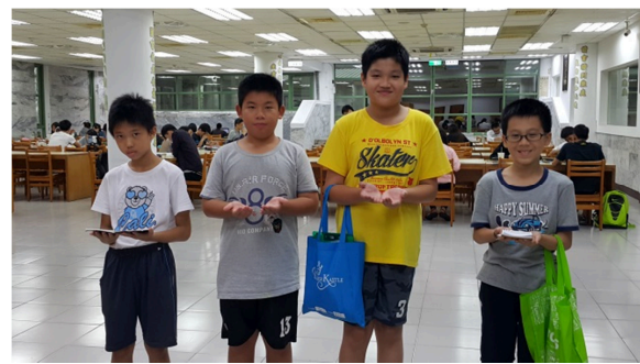
圖說：在一般圖書館閱讀，有安靜舒適的閱讀角以及借閱書籍的服務