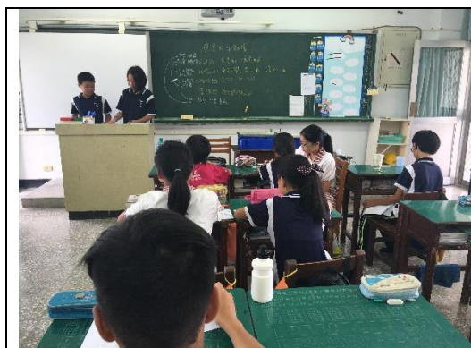
各組上台報告進度