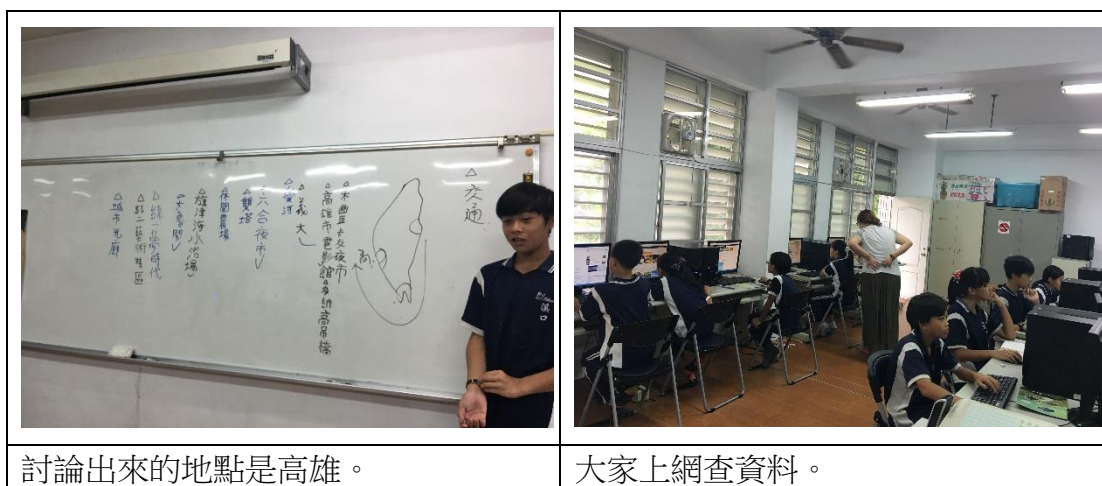
討論出來的地點是高雄。

首先，由班長帶領我們討論畢業旅行的目的地與各景點，因此我們先到電腦教室搜尋相關的資訊。