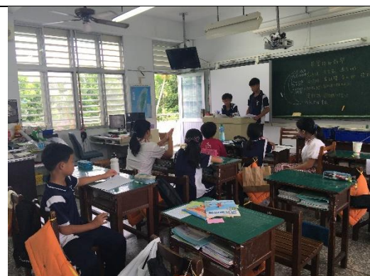
各組上台報告進度

這次的討論會議進度大幅增加，原因是分工合作先找尋自己負責的任務，例如交通組就可以利用 google map 來查詢步行的距離與時間，高雄捷運公司的網站也可以查詢各站的時間，這樣就可以省去大家有共同疑問，卻遲遲無法解決，或是全班都各查各的資料，沒有鎖定目標。所以我們解決了交通的問題以及時間的規劃縝密性。接著，大家對於這次的規劃提出了下列要解決的事項：