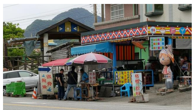
街道觀察(路邊攤特色)