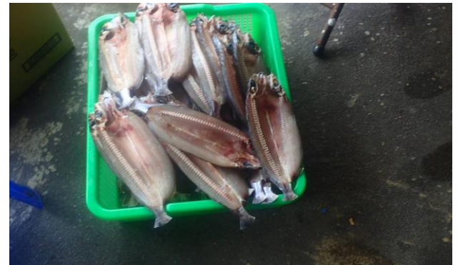
社區觀察(烤飛魚料理製作前)