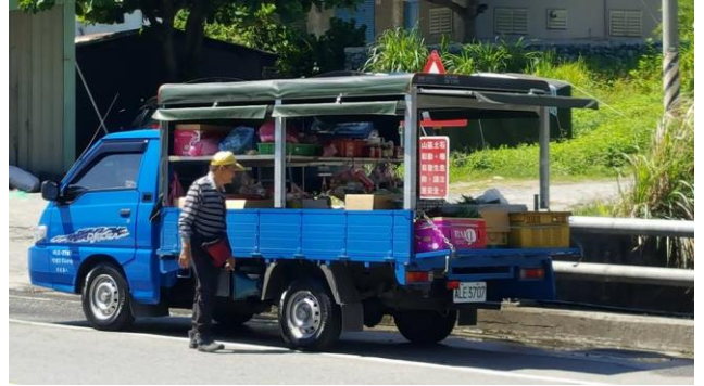
街道觀察(小發財車商店)