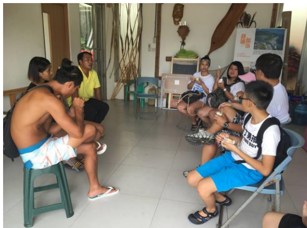
專訪靜浦部落社區營造對照與比較