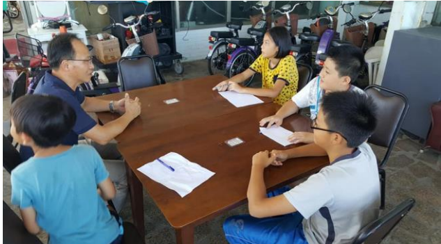
專訪某建設公司施董事長