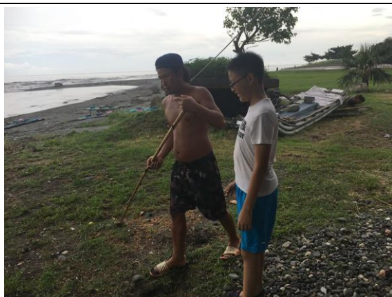
專訪靜浦部落社區(活動參考)