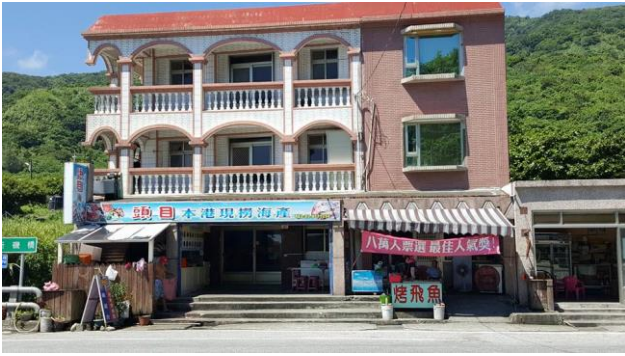
街道觀察(唯一的餐廳)