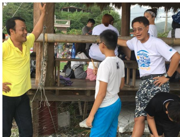
專訪靜浦部落社區理事長