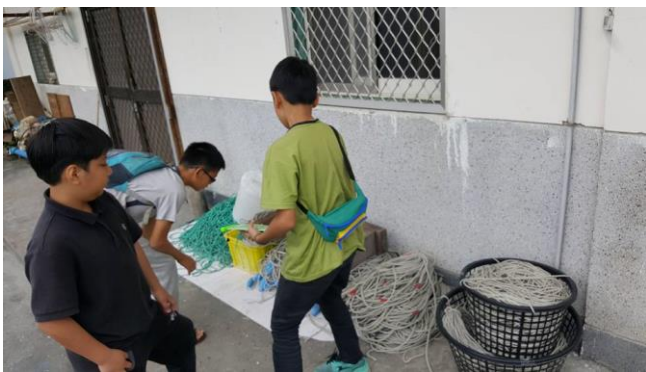
社區觀察(傳統漁具)