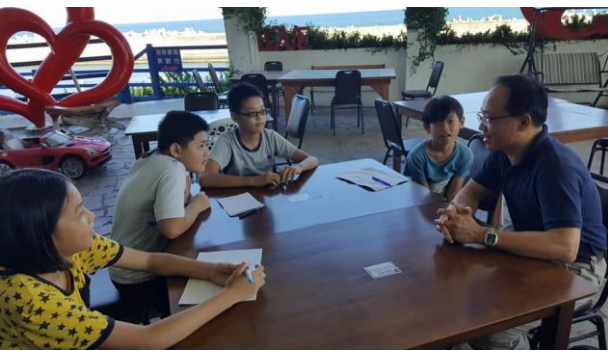
專訪某建設公司施董事長