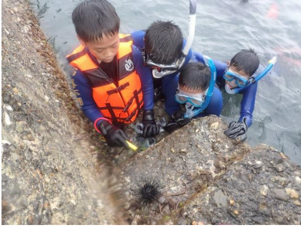
浮潛體驗(海洋生態觀察)