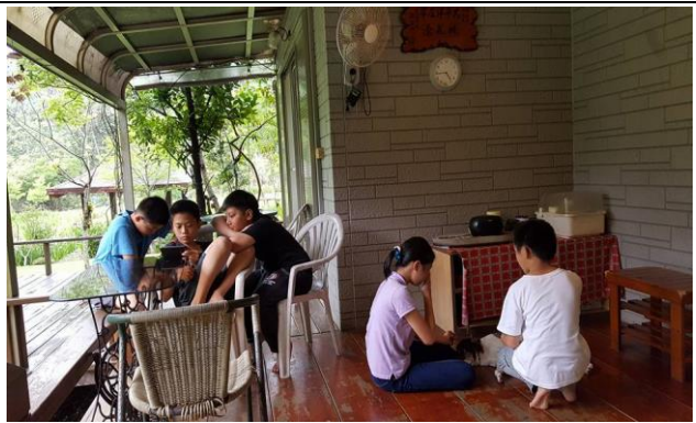
產業觀察(山林特色民宿)