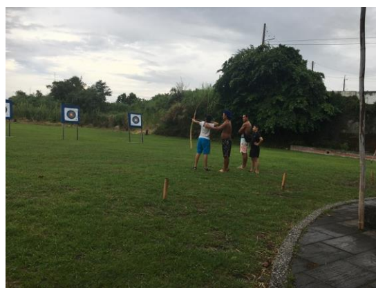
專訪靜浦部落社區(活動體驗)