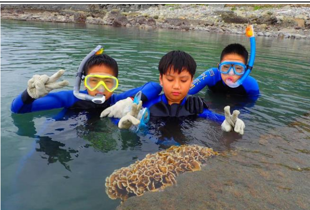
浮潛體驗(海洋生態觀察)