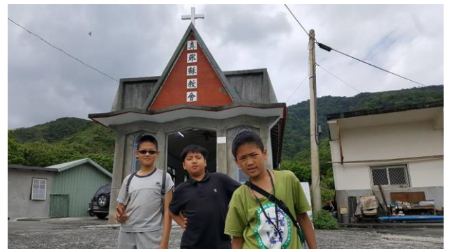
社區觀察(部落教會信仰中心)