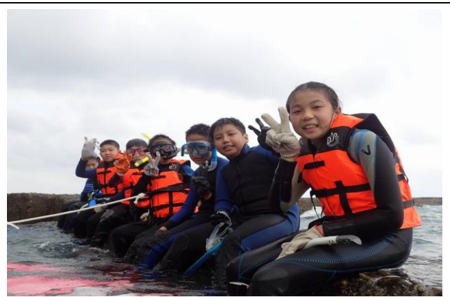
浮潛體驗(海洋生態觀察)