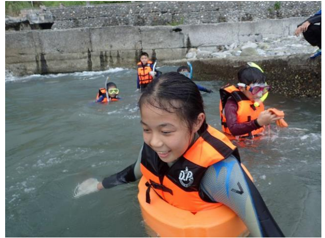
浮潛體驗(海洋生態觀察)