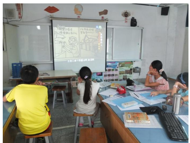
圖 2 觀看敖幼祥專訪影片

今年暑假開始花蓮成立敖幼祥漫畫圖書館，並舉辦敖幼祥漫畫營，我們組員中有兩位曾經接觸過敖幼祥的作品，加上漫畫是小學生喜歡閱讀的書籍，這些原因讓敖幼祥在最後可以雀屏中選成為我們的研究主題。經過網路搜尋獲得敖幼祥老師的相關影片（圖 2），我們發現敖老師少年得志，因為在中國時報連載的烏龍院一炮而紅，事業到達巔峰的同時但卻因為稿量太大導致創作品質下降，因此決定關掉工作室、拋開一切重新開始，隱居期間他到了花蓮靜浦，經過沉潛後再度找回創作的熱忱，重出江湖接連獲獎後，開始推動培育漫畫人才的工作。這樣的過程不禁讓我們對敖老師更加有興趣：他從出生到現在歷經了哪些的成長背景？什麼作品風格讓他的漫畫這麼受歡迎？是什麼原因讓他可以從創作低潮中站起來？又為什麼