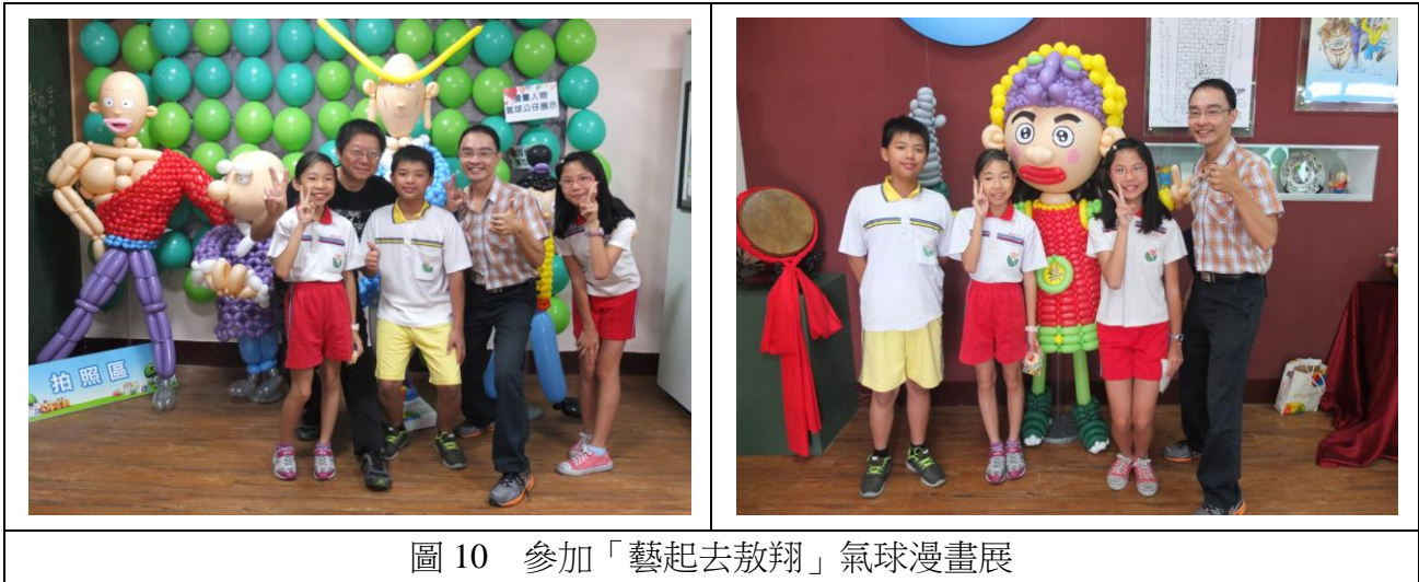
圖 10 參加「藝起去敖翔」氣球漫畫展