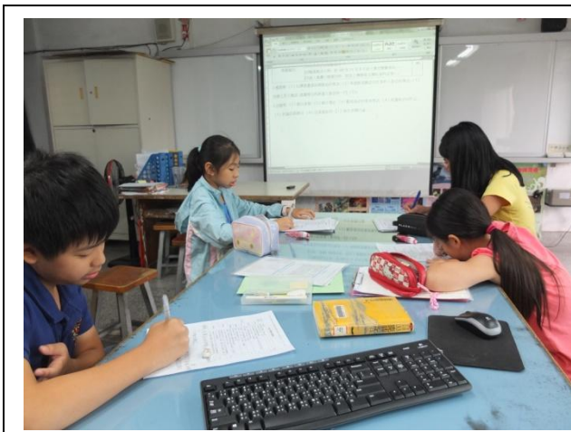
圖 1 研究主題初選評分中

依照進入複選的主題，我們再各想一個可能的延伸問題，它們分別是（1）洄瀾薯道：如何做出冰淇淋？為什麼地瓜有雙色？如何把其他產品加入冰淇淋？為什麼觀光客會喜歡它？（2）自強夜市：為什麼會人山人海？遊客最喜歡吃什麼？為什麼店家很多但是每家生意都很好？它跟其他夜市有什麼不同？（3）敖幼祥：以後想畫什麼樣的漫畫？敖幼祥的漫畫風格？為什麼當初想畫漫畫？為什麼想要搬來花蓮？經過第二輪激烈的投票，敖幼祥脫穎而出成為我們這學期專題研究的主題。