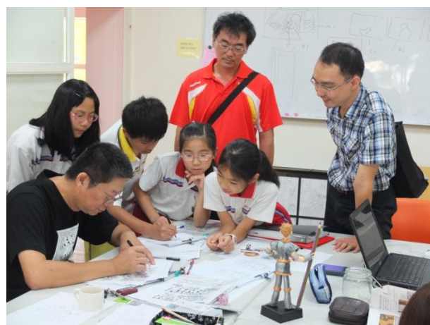
圖 8 敖老師幫大家簽名留念