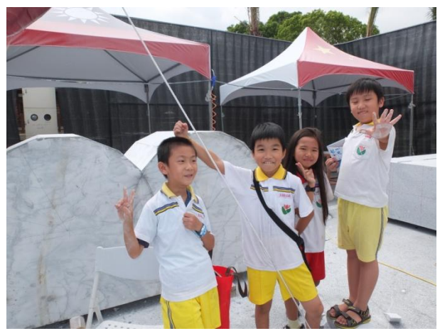
圖 7 雕塑中的石雕作品

我們要參加的論壇議程從下午兩點十五開始，進場前我們做了最後的討論（圖 8），現場坐滿從早上就開始參與的石雕家和藝術愛好者，我們坐在會場的最後排，專心的聆聽並完成簡要的筆記（圖 9）。「花蓮縣石雕發展歷程」議程中，石雕協會馮理事長介紹花蓮因為盛產石頭、石材加工業興盛，石雕藝術家逐漸累積，在工作環境和人力技術成熟的條件下慢慢提升創作風氣，1991年由許多志同道合的石雕創作者在多方奔走下，成立了國內第一個石雕協會，並由林聰惠老師擔任會長，希望能推展石雕創作理念並引入當代藝術潮流。我們研究中訪談的廖清雲老師擔任了第三屆的會長，廖老師在接受我們的訪談時提到，早期的石雕家常常沒辦法養活自己，石雕協會的成立希望能夠保障石雕工作者，讓他們能有穩定的收入可以從事創作，在人才數目和技術逐漸提升的情形下，才有今日能夠享譽國際的石雕藝術季。