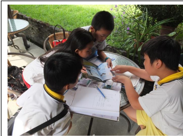
圖 8 藝術家論壇前最後的討論