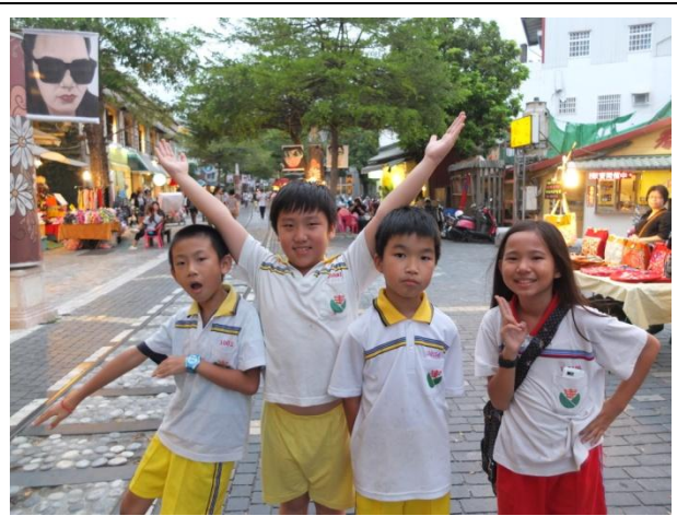
圖 12 走訪鐵道文化園區