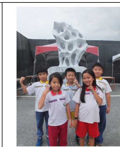
圖 18 「內世界」成品