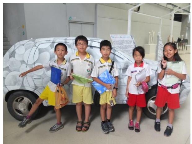
圖 5 和大廳彩繪石頭汽車合影