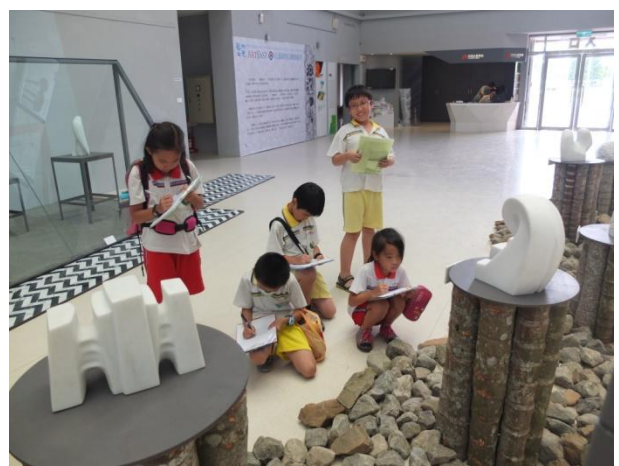
圖 3 大廳—洄瀾石光