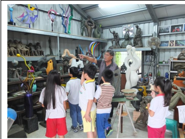
圖 15 參觀廖老師的工作室