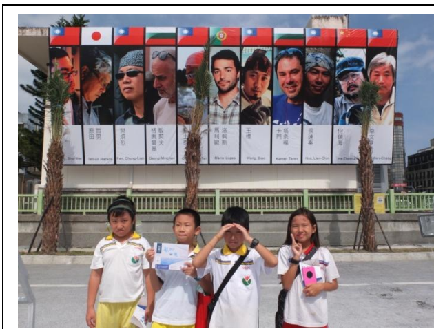
圖 6 本屆參加戶外創作營的石雕家

當天下午一點我們在石來運轉廣場集合，沿著福町路先參觀了戶外創作營，路邊掛著參與本屆戶外創作的 11 位石雕家（圖 6），現場擺放著剛動工不久、尚未雕塑完成的原石（圖 7），原來石雕作品是這樣用電鑽、錘子慢慢慢慢的雕塑而成，作品旁邊到處都是大理石粉塵，想必雕塑工作一定很不是件輕鬆的任務。我們一人選了一個自己喜歡的作品，準備等等進入藝術家論壇時聆聽石雕家的介紹。