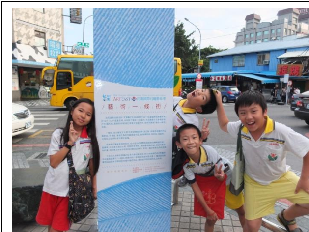
圖 11 走訪藝術一條街