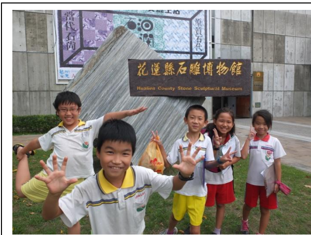
圖 2 石雕博物館參訪

10 月 2 日的參觀剛好遇到 2014 花蓮國際石雕藝術季特展「雕刻之城·美麗生活」的展期：大廳主題為「洄瀾石光」，以彩繪石頭汽車帶領參觀民眾穿越抽象的「縱谷風情」、「洄瀾海岸」、「城市聚落」與「居家生活」，敘說著石雕作品在花蓮的生活中處處可見；「原質石代」是第一企劃室的主題，擺設了許多風化石、奇石與雅石，透過藝術家的巧思擦出創意的火花，這些歷經千萬年沉積、擠壓和風化的礦石，擺在展場中讓人有一股優雅的田園景致感受；第二企劃室的主題是「當代石尚」，以陶瓷、金屬與複合媒材等不同素材，使用各具特色的擬真、寫實或抽象手法，營造令人讚嘆的藝術創作。