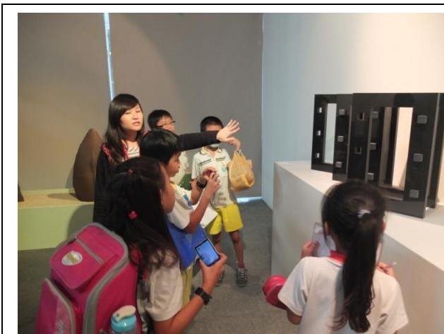
圖 4 第二企劃室—當代石尚