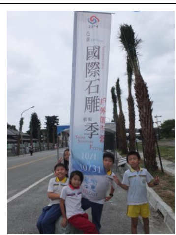
圖 19 尾聲