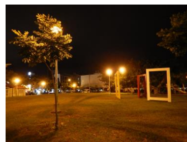
圖三 夜晚的白燈塔公園