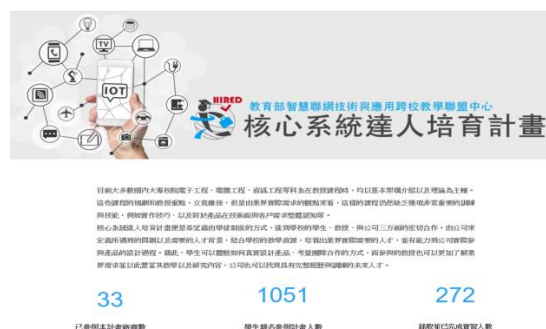
圖四：核心系統達人培育計畫介紹