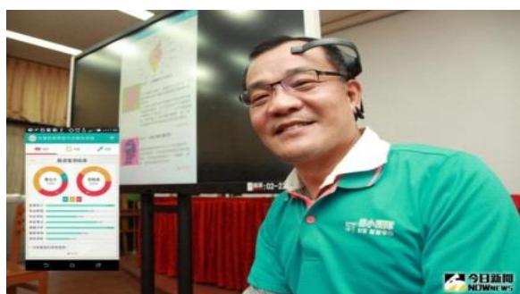
圖三：現代分類帽

若是現實中真的有分類帽的話，生活一定會便利的多。學校可以挑選想要的學生；學生可以學習適合的內容；企業可以獲得需要的人才，大大提高效率。這麼棒的東西，一定會有人想製作出來吧！經網路搜尋後，我才發現現實中已經有以「分類帽」為概念設計的事物了，以下為簡單的介紹。