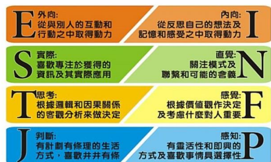
圖三：MBTI 性向分析測驗介紹

如果我是個巫師的話，會被分到哪所學院呢？基於對分類帽分類準度的好奇，我到“Pottermore”註冊了一個帳號進行了分析測驗。