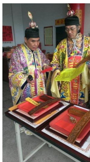
圖六 要別在冠上的金花