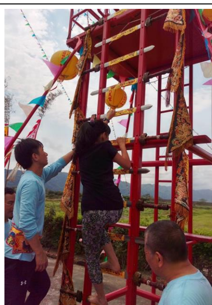
圖八 腳要跟劍平行爬上去