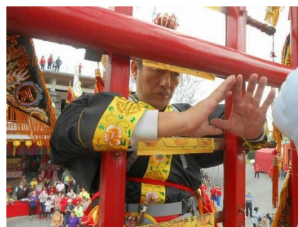
圖四 先鋒官替劍梯開光