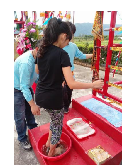
圖三 上劍梯前都需要踩符水、粗鹽淨身

第一個登梯的是先鋒官，上劍梯前需要踩米酒加符水還有粗鹽淨身除穢，他需要幫每層劍梯上的符開光，在登到劍梯頂端之後要擲筊請示自己的工作是否完成，然後要奏職的法師才可以開始攀爬；要考試的法師也是上劍梯前需要踩符水、粗鹽淨身，登到劍梯頂端也要擲筊請示是否同意能成為法師，在地面的工作人員會注意是否是一正一反的聖筊，然後法師爬後方的梯子下來，把服裝整理好再到傳度師前鞠躬行禮，傳度師會在冠上為他別上金花，表示晉生為新科的法師。