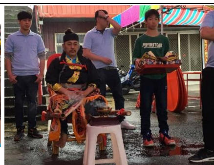
圖二 著裝完準備登梯的法師