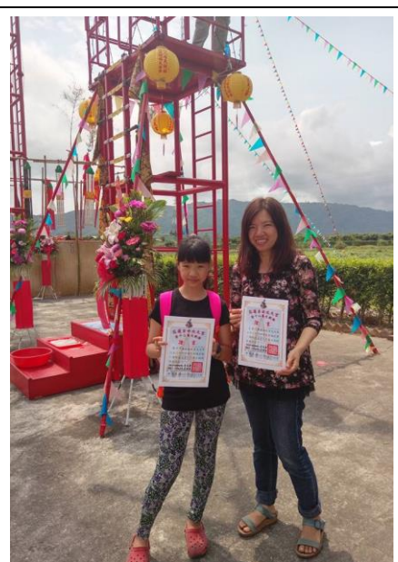
圖十 完成可以得到一張證書