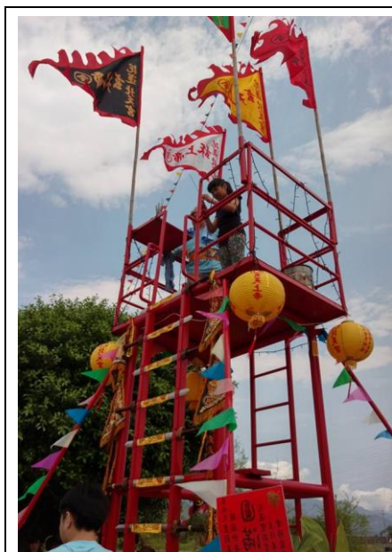
圖九 到梯頂要上香