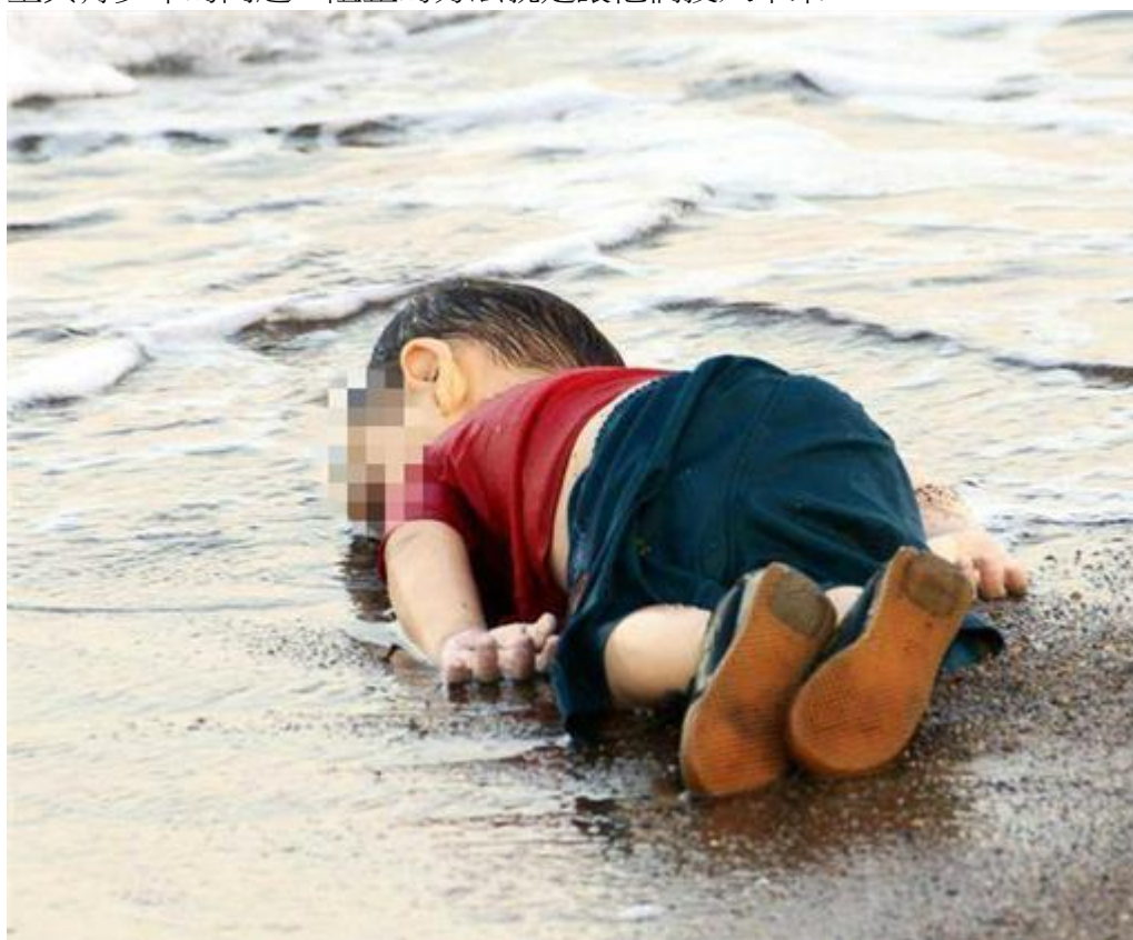
圖二：敘利亞男童之死

某間黎巴嫩 NGO 教育中心的工作人員說：「難民兒童來到這裡時，少於 1% 的人會說自己有希望，他們畫畫時，他們畫的都是關於戰爭的東西，我把顏料放在他們面前，他們總選黑色。」精神科醫生柯巴奇女士她說自殺是難民兒童與青少年的問題，阻止的方法就是讓他們投入未來。