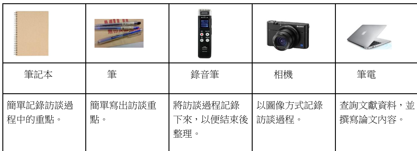
表 6-1：研究工具及用途說明

如表 6-1 所示，本研究所使用到的工具為筆記本、筆、錄音筆、相機和筆電。由於本研究的訪談時間太長，故以有涉及訪談題目的內容為主來進行逐字稿整理。