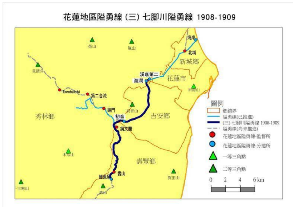
圖 2 七腳川社事件相關隘勇線